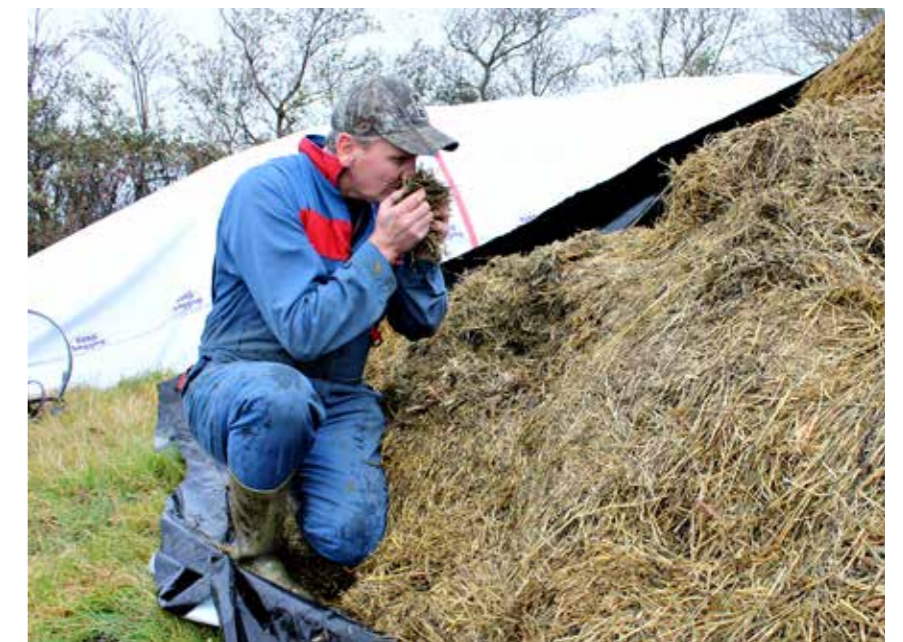
NØGD: Haarr har vore godt nøgd med konsistensen, lukta og smaken på fôret.

Fuglar som pikkar hol i plasten, har ikkje vore