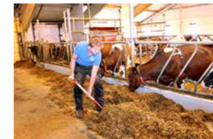
FÖRMIKSAR: Haarr blandar fôret etter oppskrift frå Keenan og kjører det ut med mobil fôrmiksar.