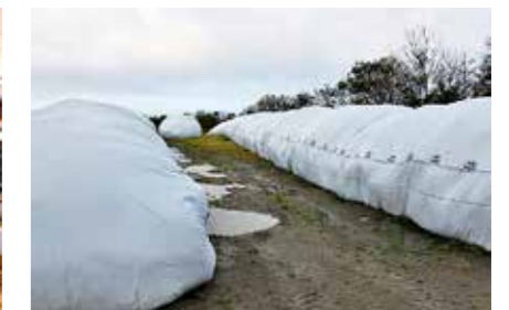
LAGRING: Ei 50 meter lang pølse tilsvarar innhaldet i om lag 300 rundballar. Diameteren på pølsene er 2,5 til 3,0 meter.

noko problem. Pølsene har ikkje vore beskytta verken av nett eller anna vern.